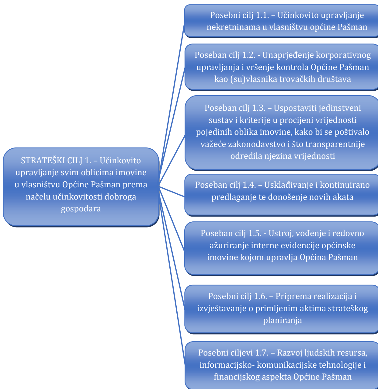
Slika 2. Kaskadiranje strateškog cilja upravljanja općinskom imovinom